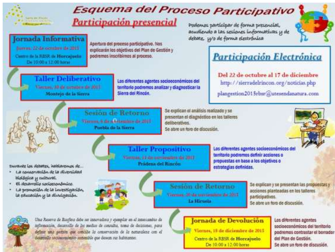
Figura 1. Esquema del proceso participativo que se llevará a cabo.